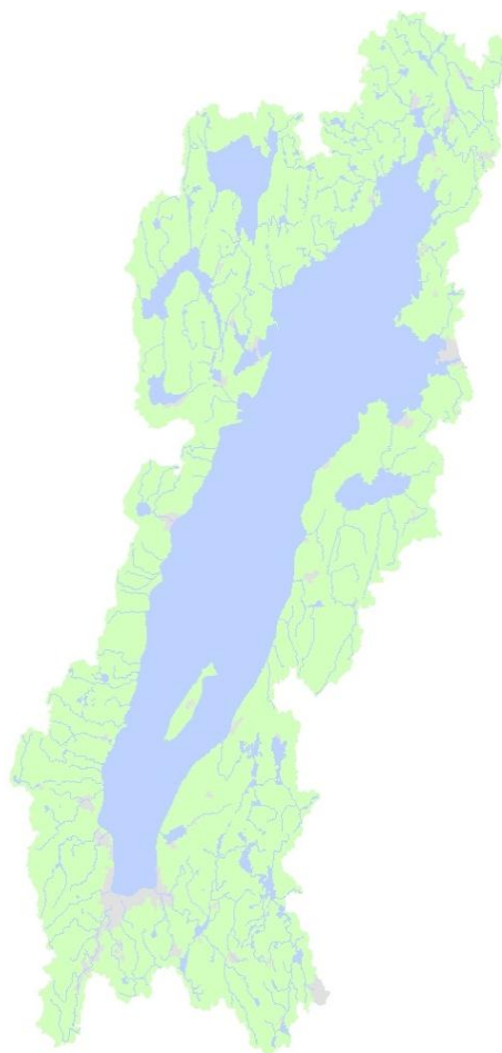
Figur 1. Karta över avgränsningsområde för FOG-Vättern.

Den 9 april 2009 bildades FOG-Vättern under Samförvaltning Fiske i Vätternvårdsförbundets organisation. Med en budget på 5,5 miljoner EFF medel och 550 000 i offentliga medel blev Vättern ett av 14 FOG-områden i Sverige. Inom Vätterns avrinningsområde finns sammanlagt fyra län och 21 kommuner. Den geografiska avgränsningen för FOG Vättern utgörs av de åtta kommuner som har direkt beröring med Vättern, dessa åtta kommuner ansvarar för drygt 80 % av avrinningsområdets yta, inklusive sjöytan (Figur 1). Då kommuner anses vara viktiga regionala samarbetspartners för genomförandet av FOG-områdets utvecklingsstrategi har kommungränser bedömts vara den lämpligaste geografiska avgränsningen. De åtta kommuner som innefattas i FOG Vättern har i och med sin direktkontakt med Vättern en starkare koppling till sjön än övriga kommuner i avrinningsområdet (Tabell 1). I dessa åtta kommuner har man redan tidigare jobbat med frågor och projekt som rört Vättern.